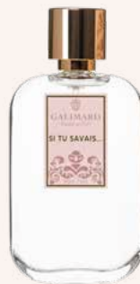
Réf. 3460 Vaporisateur rechargeable 100 ml • 29,50€